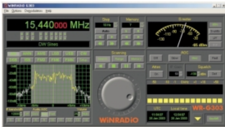
Ein DRM-Signal der Deutschen Welle auf 15440 kHz

derart enge Einbindung eines Empfängers in ein Computersystem bietet.