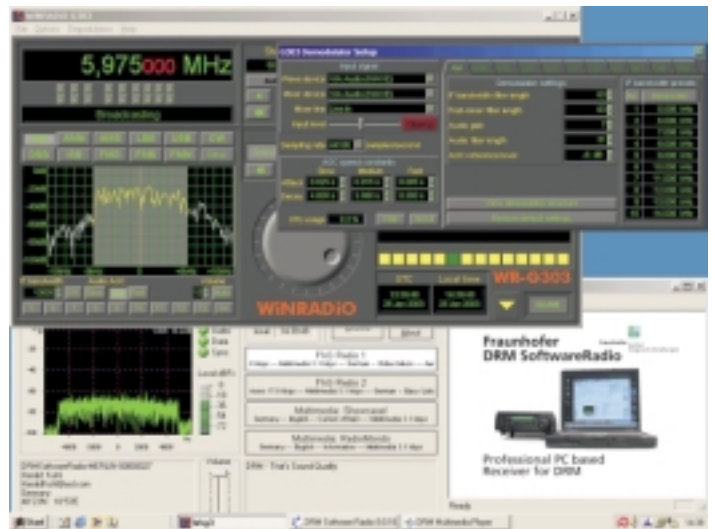
WinRadio: DRM-Empfang auf 5975 kHz

Nach dem ersten Programmstart sollten zunächst einige Einstellungen vorgenommen werden, die das reibungslose Zu-