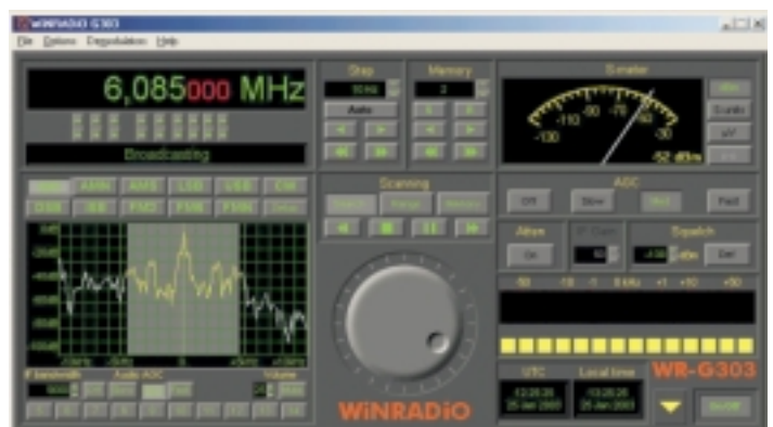
Empfang von BR München auf 6085 kHz

Für die Bedienung des WR-G303i werden die Tastatur und die Maus des Computersystems benötigt, außerdem natürlich der Bildschirm, auf dem die Bedienoberfläche dargestellt wird. Wer zuvor einen herkömmlichen Kommunikationsempfänger bedient hat, muss sich erst an dieses Bedienkonzept ohne fühlbare Knöpfe und Regler gewöhnen. Leichter haben werden es Nutzer, die ohnehin viel mit dem Computer arbeiten und in erster Linie die faszinierenden Möglichkeiten sehen, die eine