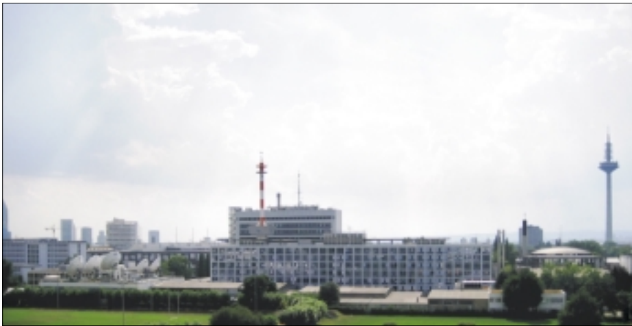
Gelände des Hessischen Rundfunks in Frankfurt am Main.

dort, wo sich nichts geändert hat.“ Es werde „viel eher eine tendenziell ältere, private Hörschaft treffen, die keine Blogs betreibt, kulturell kaum vernetzt ist und allenfalls beim HR anruft oder einen Leserbrief an die Lokalzeitung schreibt“. Der „scheinbar ausbleibende Aufschrei“ dürfte daher „am Küchentisch oder als Seufzer im Auto verhallen“.