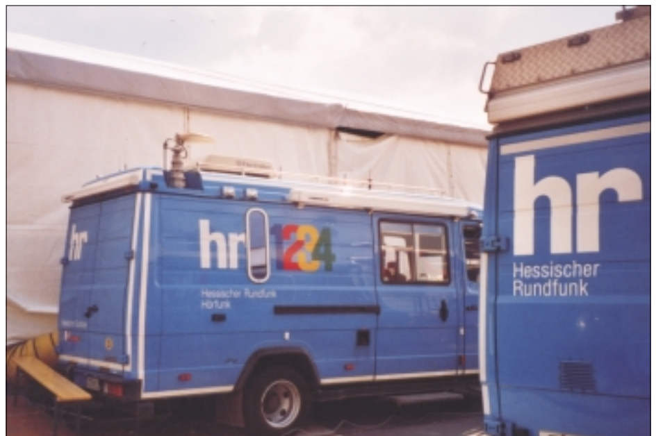
Hörfunk-Übertragungswagen des Hessischen Rundfunks im Jahre 2003, noch mit dem alten Werbedesign für die vier angestammten HR -Programme.