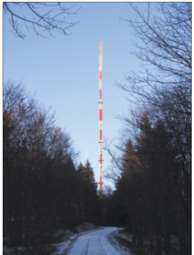
Der vom WDR mitgenutzte HR-Sender Sackpfeife bei Biedenkopf.

Wer von der Erkenntnis auszugehen pflegt, dass die elektronischen Medien ein empfindlicher Indikator für gesellschaftliche Entwicklungen sind, der könnte hier zu kulturpessimistischen Einschätzungen gelangen. Ein Beobachter formulierte in diesem Zusammenhang „Fassungslosigkeit“ nicht nur über das Vorgehen des Hessischen Rundfunks , sondern auch über „die offenbar nur wenige Atomschichten messende Zivilisationsdecke im UKWTV-Forum“. Damit gemeint war das dort zu besichtigende, von den üblichen Klischees geprägte Meinungsbild über klassische Kulturprogramme und deren Hörer, das bis hin zu offener Verachtung ging. Kenner der Szene fühlen sich da unweigerlich an Vorgänge wie etwa in Bonn erinnert, wo mit einem Bürgerbegehren die Schließung des dortigen Opernhauses durchgesetzt werden soll.