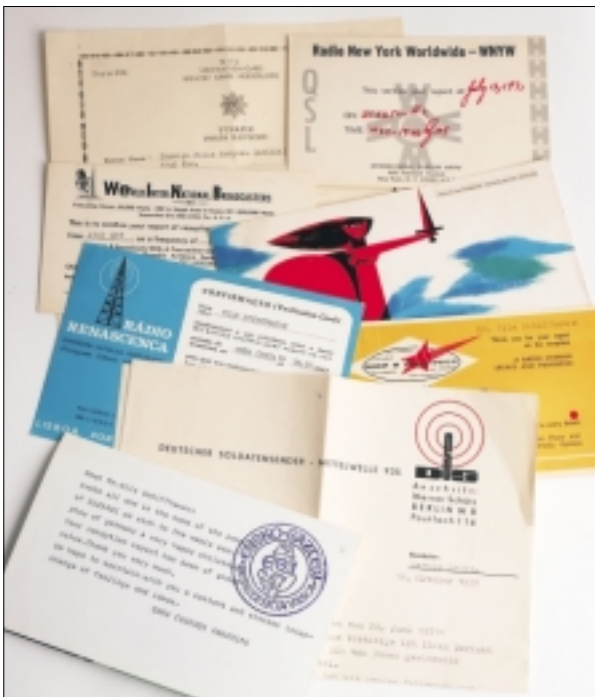
Sender, die von der Kurzwelle verschwunden sind: Türkiye Polis Radyosu auf 6.340 kHz, WNYW schloss im Oktober 1973, WINB, der Sender der Polnischen Pfadfinder auf 6.850 kHz, der Religionssender Radio Renascenca aus Portugal, Gewerkschaftsender Radio Frieden und Fortschritt aus Moskau, der Deutsche Soldatensender aus Burg mit einer absolut raren QSL und der „Geheimsender“ Radio Euzkadi für das Baskenland (in Leserichtung).

Text, QSLs und Abbildungen: Nils Schiffhauer [29]