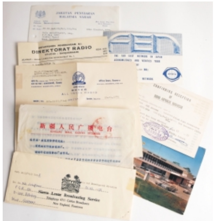
Exotik pur, die erste: QSLs von Radio Malaysia/Sabah in Kota Kinabalu, RRI Banjarmasin auf 3.250 kHz, Far East Network Tokyo auf 3.910 kHz, All India Radio Simla, RRI Sorong auf dem zu Indonesien gehörenden Teil Niuginis, eine der ersten QSLs aus Xinjiang, Radio Malaysia Sarawak und Sierra Leone.

Die Orientierung am Gebrauchswert hat eine weitere Ursache. Dem durchschnittlichen Leser ist ja der Nutzen eines Radios zu vermitteln. Und da hilft ihm kein Zahlenfriedhof von Messwerten und technischen Daten, da er die ja nicht zu einem Höreindruck zusammenbekommt. Fragen in Leserbriefen an die „funk“, aber auch die Inspektion defekter Geräte in Service-Werkstätten des Amateurfunkhandels zeigen, dass Forderungen nach chirurgischen Testberichten und das Verständnis für diese in einem denkbar diametralen Gegensatz stehen. Sobald es PC-mäßig möglich war, habe ich deshalb versucht, den Höreindruck auch durch Bilder in das Druckmedium zu transportieren.