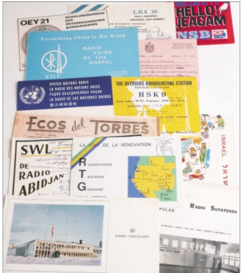
Bild rechts: Immer wieder gerne gehört: Schulungssender des Österreichischen Bundesheeres OEY21 von 1971, LRA36 von der argentinischen Antarktisstation „Esperanza“ NSB-Tokyo morgens auf 3.925 kHz, ETLF aus Addis Abeba, Jemen auf 5.060 kHz mit 7,5 kW, Vereinte Nationen und Thailand (4.830 kHz) sowie der israelische Soldatensender Galei Zahal, dessen überhaupt erste QSL-Karte der 19-Jährige in Tel Aviv selbst abholte. Darunter Ecos del Torbes/Venezuela, Gabun, Radio Grönland auf 3.999 kHz und Radio Sutatenza, der starke Kolumbianer.

ändern. Impulse jedoch könnten vom „GNU Radio“ [26] ausgehen – einem modularen SDR-Konzept, das vom Empfänger zum Sender, von Längstwelle bis zu den höchsten Frequenzen und von AM bis HDTV mit gemeinfreier Software große Zukunftschancen hat.